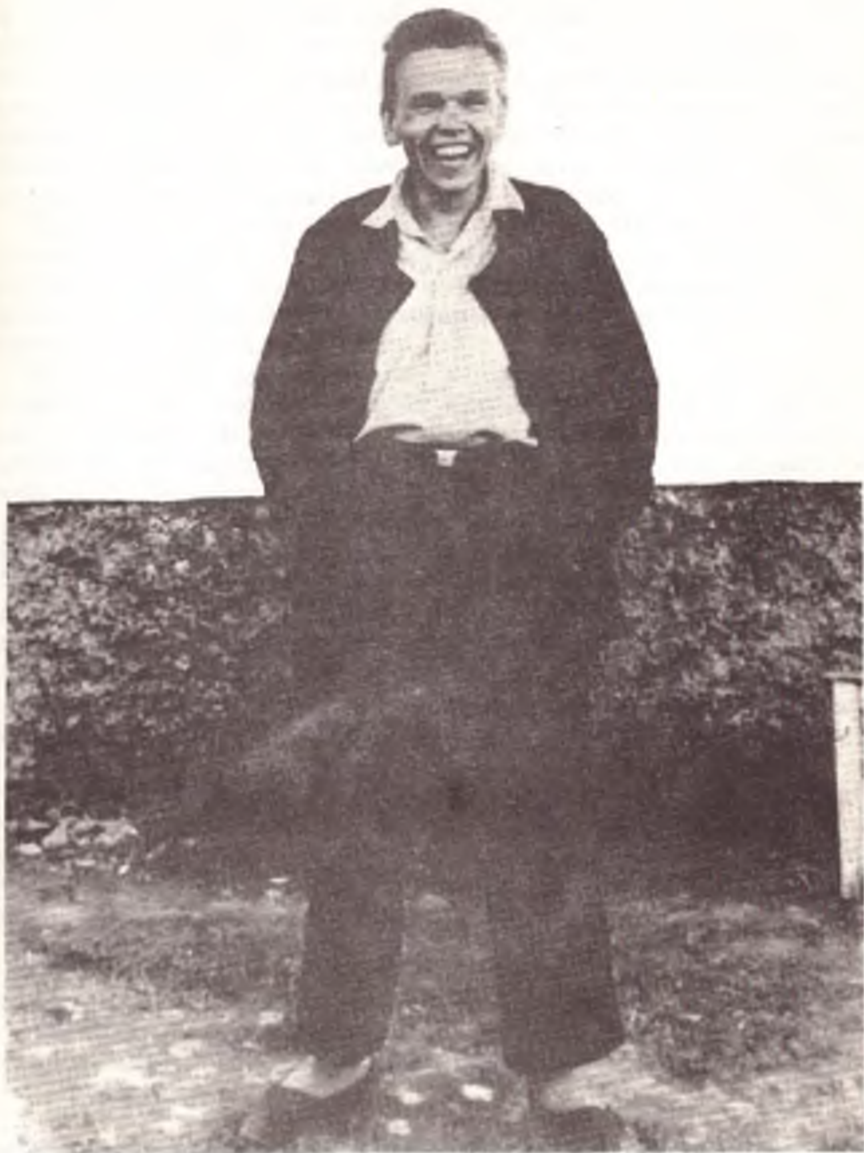
Револьт Пименов – математик, один из зачинателей сопротивления тоталитаризму в нашем городе. Организовал выпуск бюллетеня „Информация“, активный автор самиздата 1950–80 гг. Дважды репрессирован органами КГБ. Народный депутат России