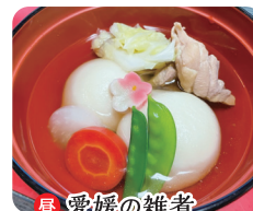
昼・愛媛の雑煮 夜 1,100円(税込)