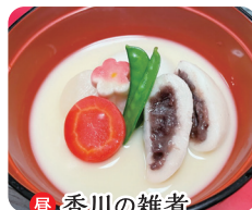
昼・香川の雑煮 夜 1,100円(税込)