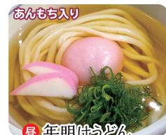
昼・年明けうどん 1,000円(税込)