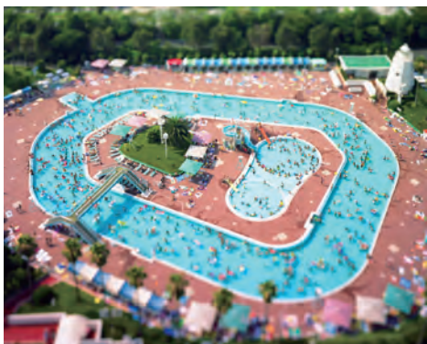
本城直季 〈Small Planet〉より《東京 日本 2005》 2005年 発色現像方式印画