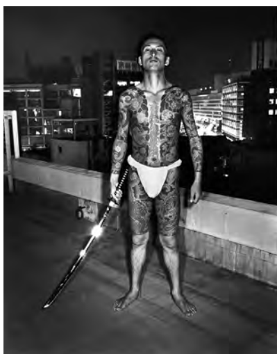
倉田精二 〈FLASH UP〉より 〈入墨の男 池袋・文芸座通りビル屋上〉 1975年 ゼラチン・シルバー・プリント