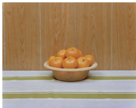
安村崇 〈日常らしさ〉より〈みかん〉 2002年 発色現象方式印画