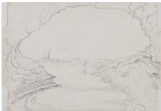
ジョン・ハーシェル 《海辺の断崖にある洞窟、デヴォン州ダウリッシュ》 1816年 カメラ・ルシダを用いたドローイング