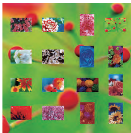
蜷川実花 〈flowers〉 2015年 発色現像方式印画、インクジェット・プリント