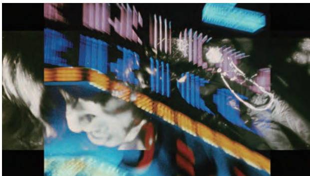
松本俊夫 《つぶれかかった右眼のために》 1968年 16ミリフィルム (マルチ・プロジェクション)