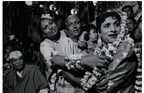
ダヤニータ・シン 《第3の性》 2002年 ゼラチン・シルバー・プリント