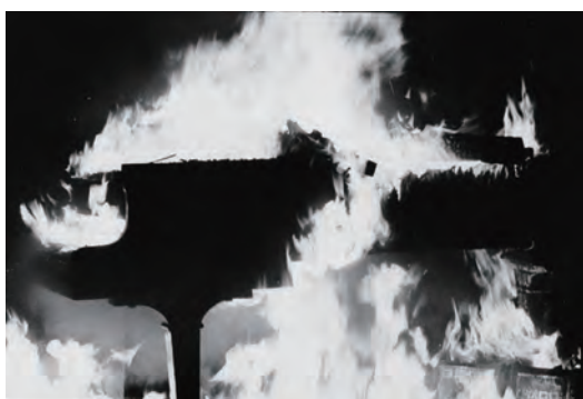
山崎博 〈Early Works〉より〈山下洋輔2〉 1969年-1974年 ゼラチン・シルバー・プリント