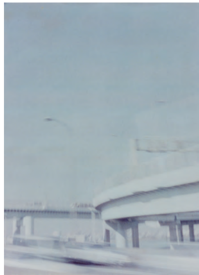
花代 〈無題〉 1989年 発色現像方式印画