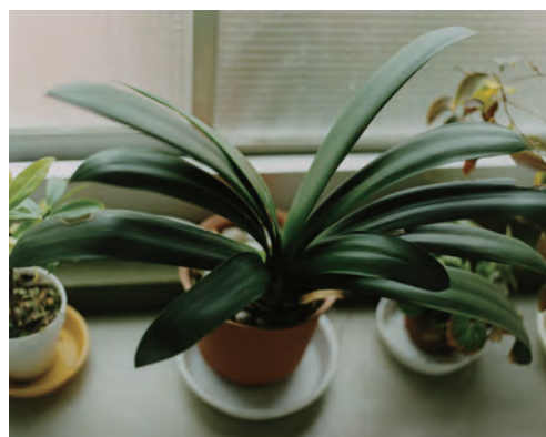
佐内正史 〈生きている〉より 1995年 発色現像方式印画