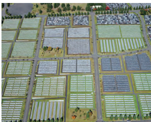
松江泰治 〈JP-01〉より〈JP-01 55〉 2014年 発色現象方式印画