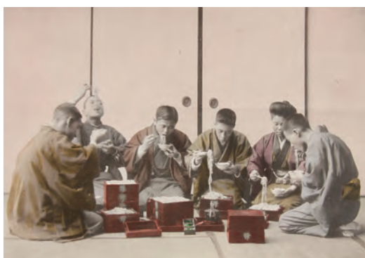
高木庭次郎 〈The New Year in Japan〉より 1906年 コロタイプ印刷に手彩色