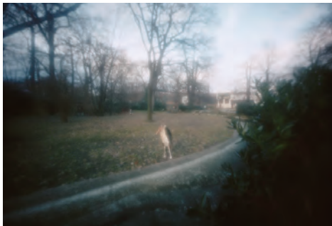
野口里佳 〈Marabu〉より〈#14〉 2005年 発色現像方式印画