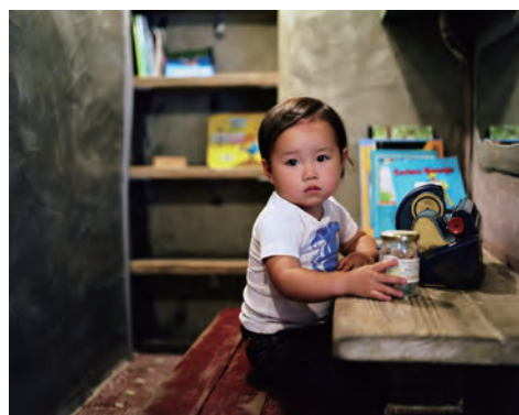
ホンマタカシ 〈Tokyo and My Daughter〉より 1999年-2010年 発色現像方式印画