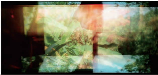
アピチャッポン・ウィーラセタクン 《Ashes》 2012年 シングルチャンネル・ビデオ