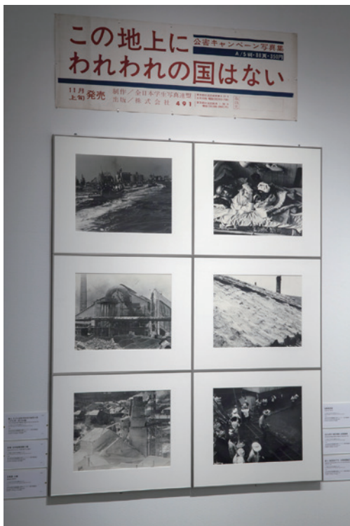
「日本写真の1968」 会場風景