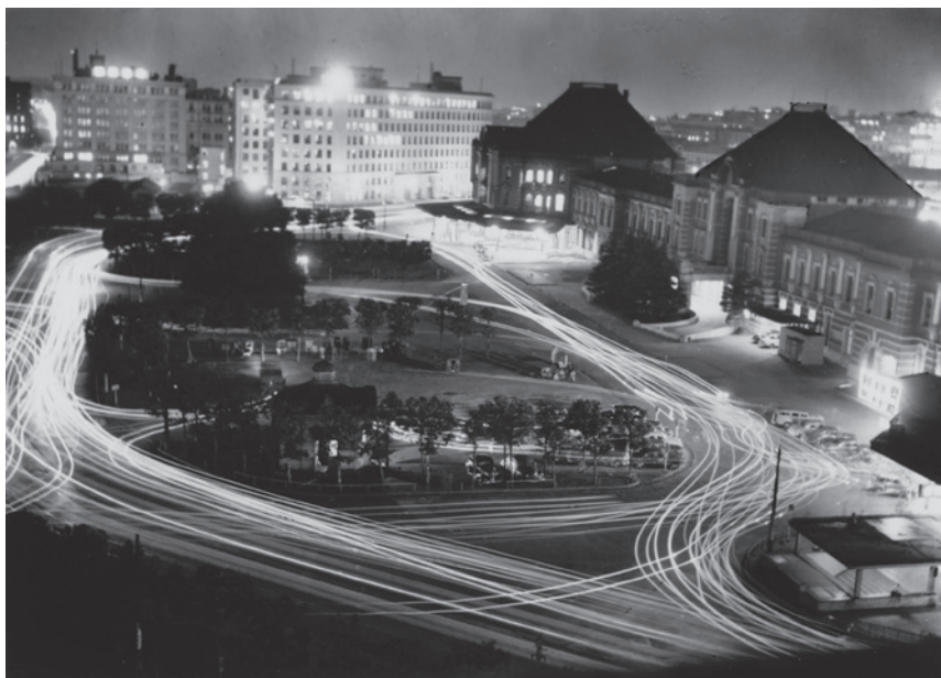
大東元《東京駅前》1950年 東京都写真美術館蔵