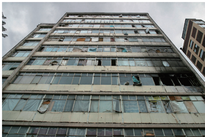
San Jose, a block of flats in Olivia Street, Berea