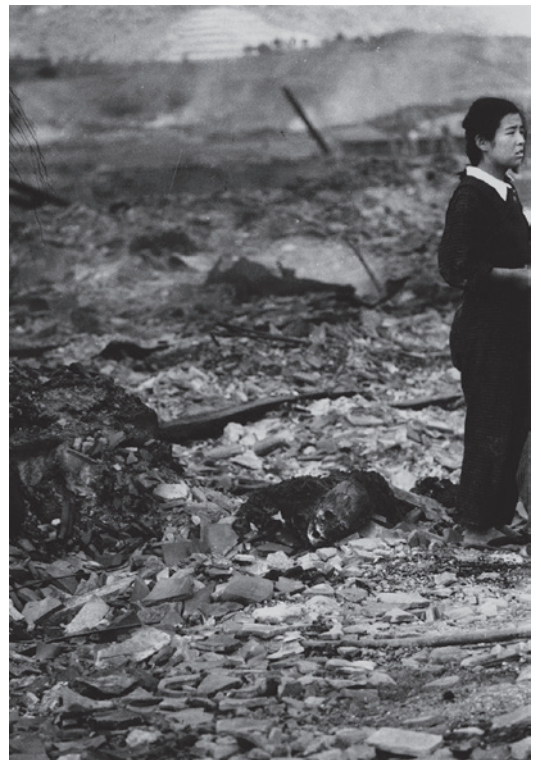
山端庸介 焼死体のわきに、茫然と立ちつくす若い女性（浜口町付近、南500m） 1945年8月10日午後1時過ぎ 東京都写真美術館蔵