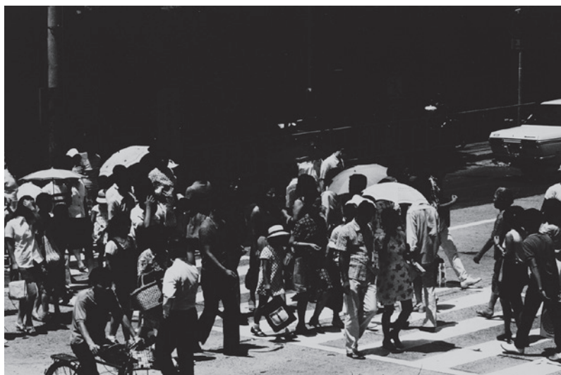
全日本学生写真連盟広島デー実行委員会 「ヒロシマ・広島・hirou-jima」より 1968-71年 個人蔵