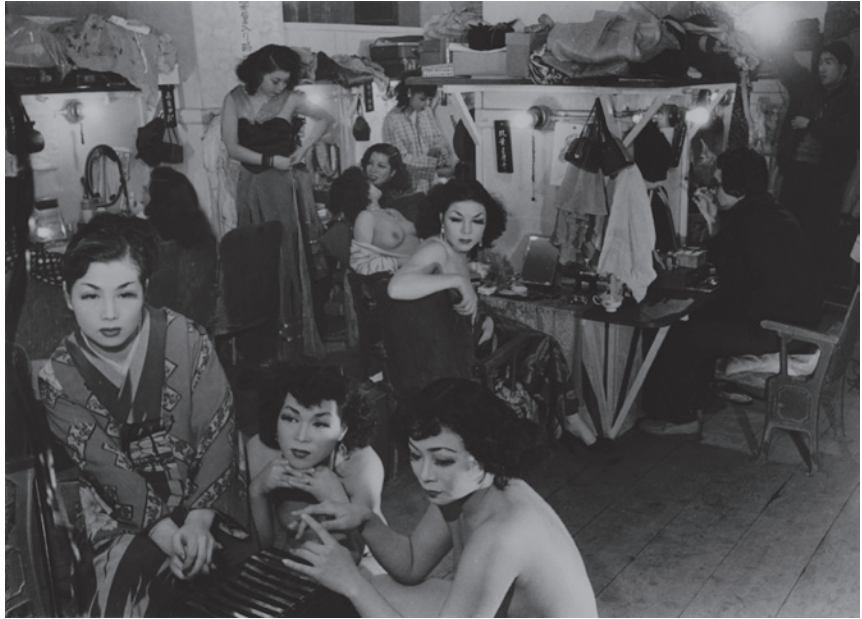
大東元《カジノ座の人々》1953年 東京都写真美術館蔵