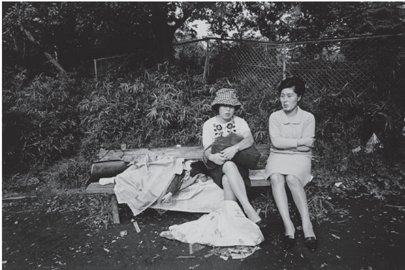
牛腸茂雄 「日々」より 1967-70年 東京都写真美術館蔵