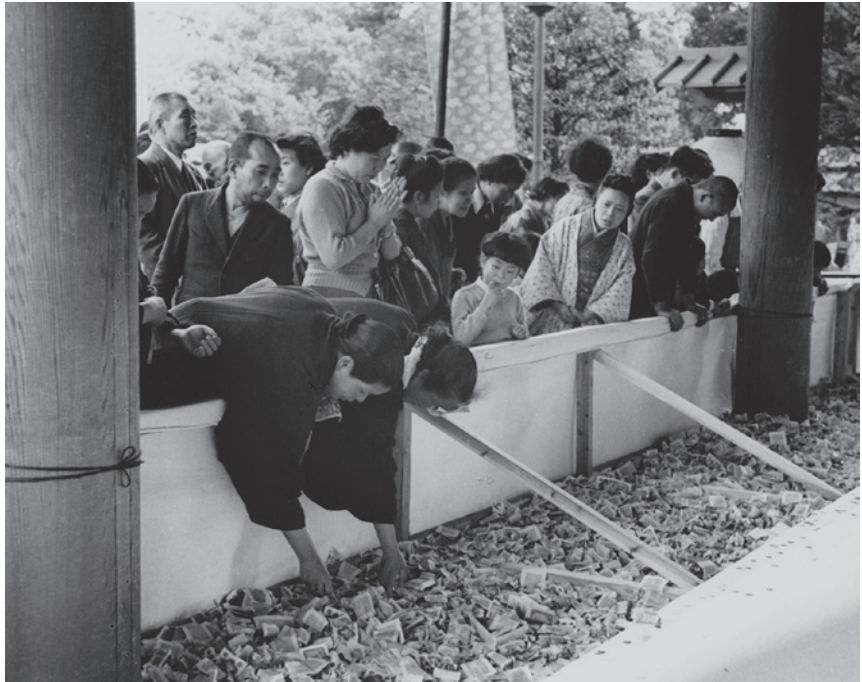
大東元《靖国神社大祭》1952年 東京都写真美術館蔵