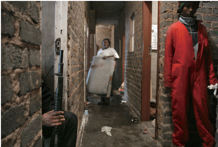
Eviction by the Red Ants, Auret Street, Jeppestown