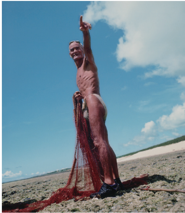
東松照明 開いた海—奄美、「われらをめぐる海」より 1966年 東京都写真美術館蔵