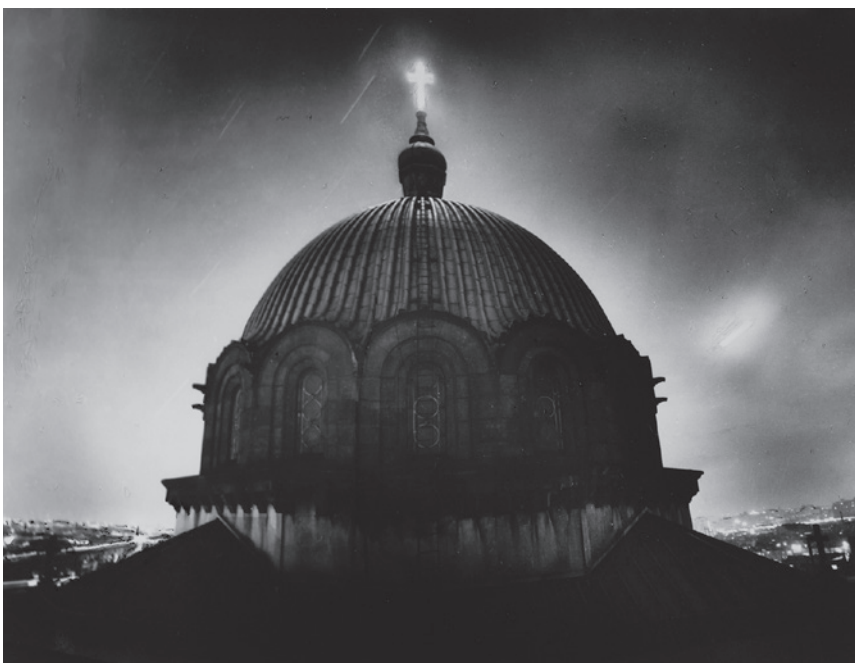
大東元《ニコライ堂》1951年