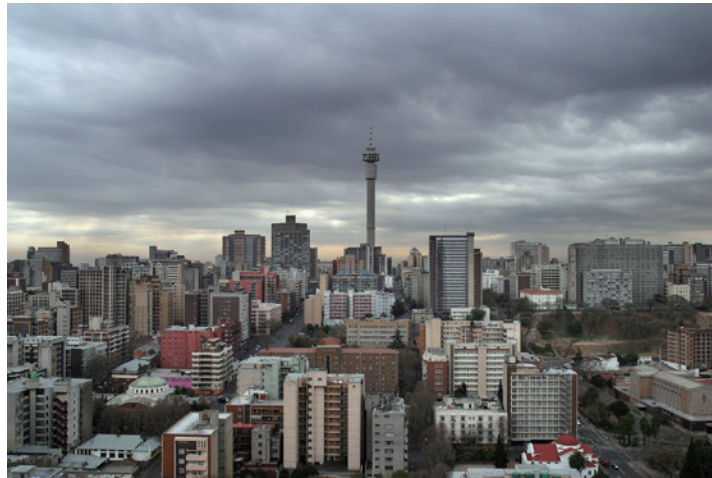
View of Hillbrow looking north from the roof of the Mariston Hotel