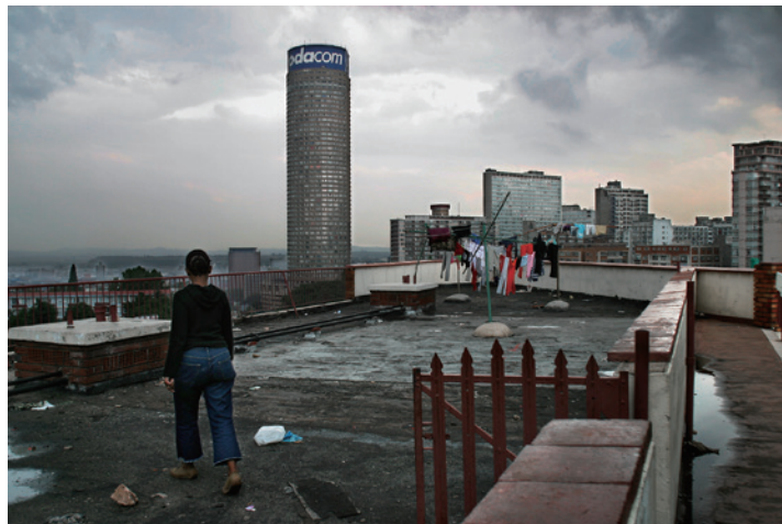
Al's Tower, a block of flats on Harrow Road, Berea, overlooking the Ponte building