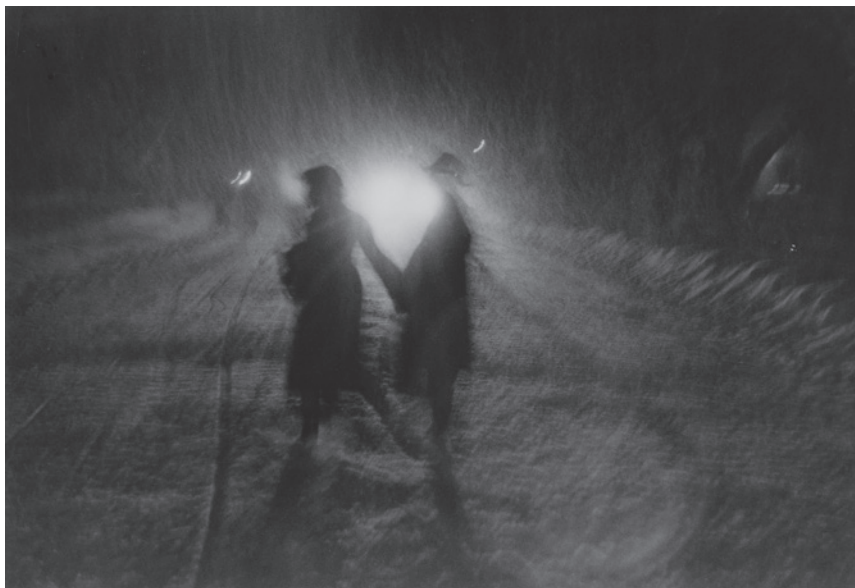
大東元《雪の幻想》1953年 東京都写真美術館蔵