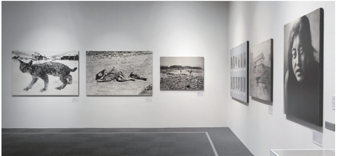
「日本写真の1968」 会場風景