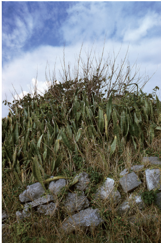
中平卓馬《奄美》1975年 個人蔵