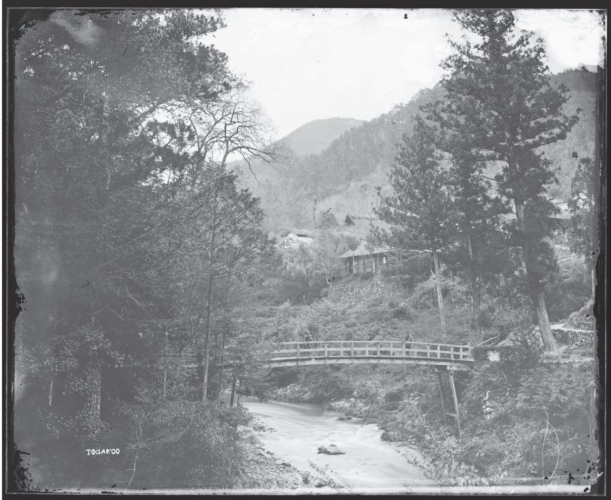
図 4 (詳細は 13 ページ参照)