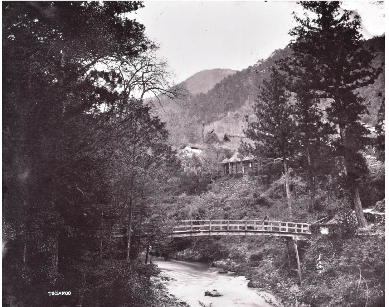
図5 (詳細は13ページ参照)