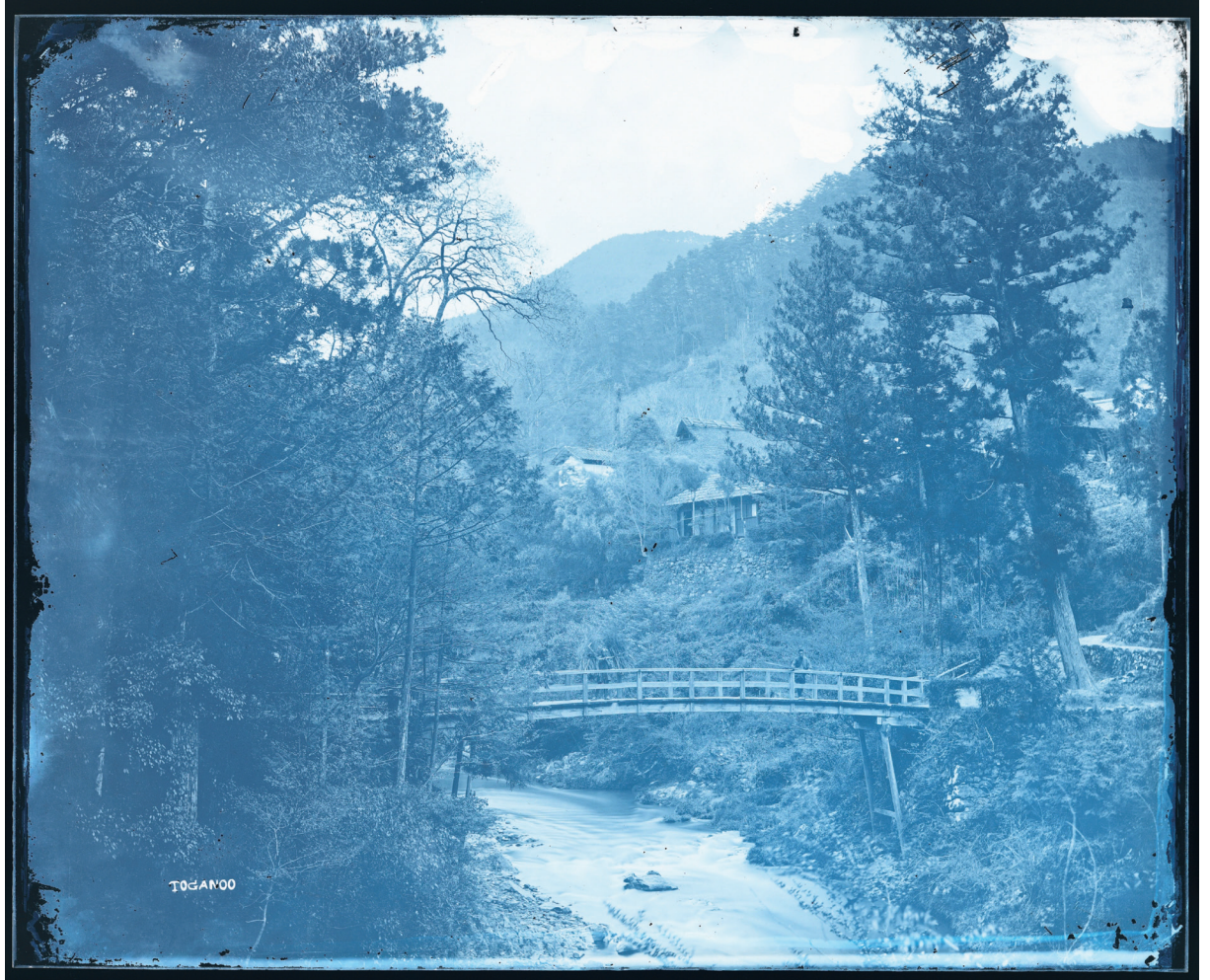
图3 (詳細は12ページ参照)