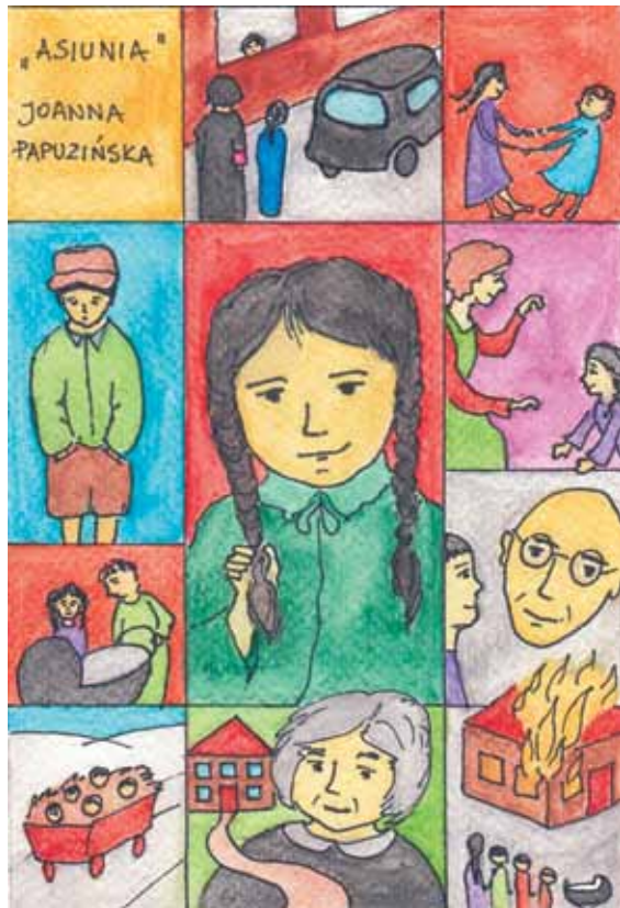
Karta literacka Asiunia , słowo-klucz: dzieciństwo wojenne Wykonanie: Anna Klimczak