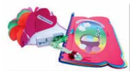
2. Książki rozkładane