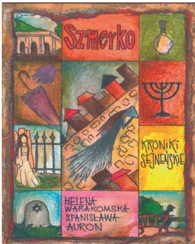
Karta historyczna Rachela Wykonanie: Dominika Turowicz