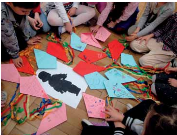
Końcowe działania z latawcami jako podsumowanie spotkania z książką Asiunia

Na zakończenie zajęć Elżbieta Hornowska wykorzystała plakat z pomnikiem Małego Powstańca. Zadała dzieciom pytanie: Co jest dla nas ważne dziś, a co mamy dzięki temu, że walczył Mały Powstańiec? Uczniowie samodzielnie wykonali kolorowe latawce, napisali na nich ważne rzeczy, którymi się dziś cieszą (wolność, szkoła, rodzina), i ułożyli je wokół postaci z pomnika.