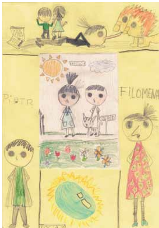
Karta literacka Karolcia Wykonanie: uczennica klasy II pod opieką Elżbiety Hornowskiej

Karty literackie można oczywiście robić z dziećmi (nawet pięcioletkami). Jako spontaniczni twórcy zwykle nie mają oporów, które towarzyszą starszym, krytycznie nastawionym do własnych umiejętności. Dzieci wykonują swoje karty na kartkach bloku technicznego A4. Należy przygotować wcześniej kartkę z narysowanymi polami. Młodszym dzieciom proponujemy mniej pól do zagospodarowania, w odpowiednio dobranych proporcjach.