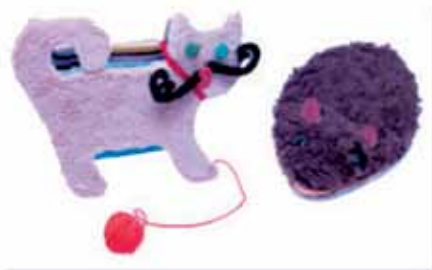
3. Książki w różnych kształtach