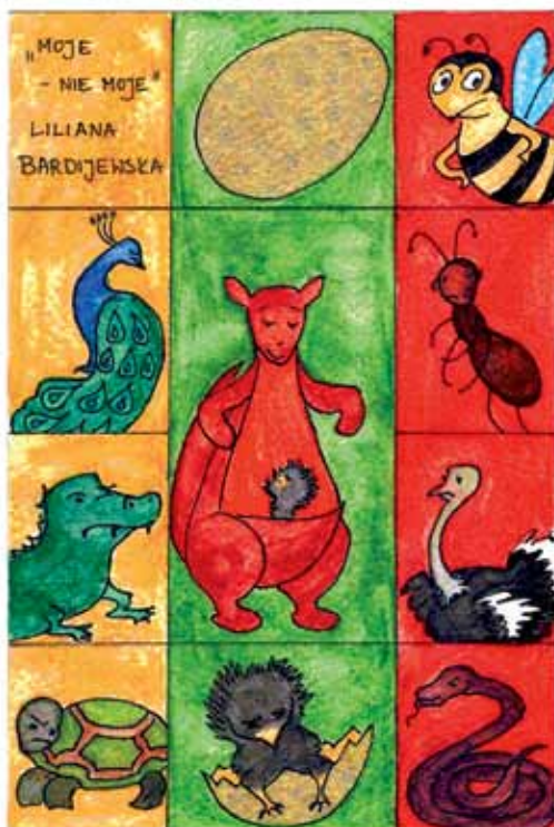
Karta literacka Moje – nie moje , słowo-klucz: akceptacja Wykonanie: Anna Klimczak