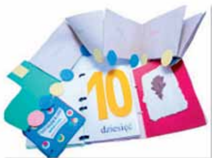
4. Różne faktury

Oczywiście nawiązują do wiersza Juliana Tuwima. Najczęściej działa tu proste skojarzenie: pociąg coś wiezie, więc przywozi zadania dla dzieci. Lokomotywa prezentowana na zdjęciu 4. została zrobiona z szarych kopert przeciętych na pół, którym dokleiono mocne kartonowe kółka, by można ją postawić. Wagoniki są podpisane, zgodnie z potrzebami dydaktycznymi „wiozą”: nazwy miesięcy, tytuły książek, nazwy miast polskich albo imiona uczniów. W kopertach-wagonikach docierają różne zadania: pytania, na które dzieci mają znaleźć odpowiedź, teksty do czytania, zagadki, rebusy, materiał graficzny, zadania matematyczne... Lokomotywy można zrobić również z pudełek czy pojemników. Pomagają „podróżować” po okolicy, po Polsce.