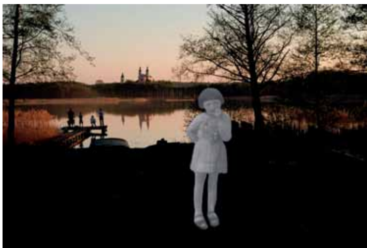
Blumka na Wigrach