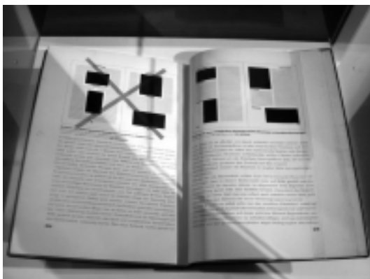
Extrait de Grid Systems in Graphic Design, Josef Müller-Brockmann, 1961