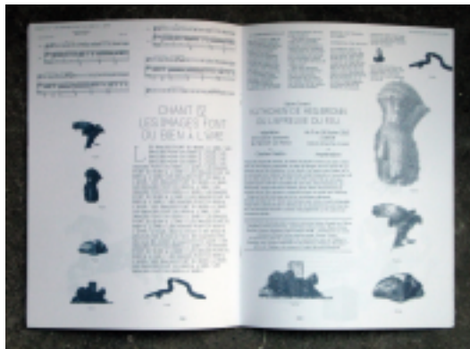
une capture d'écran de la page Html du programme de la saison 2013-2014