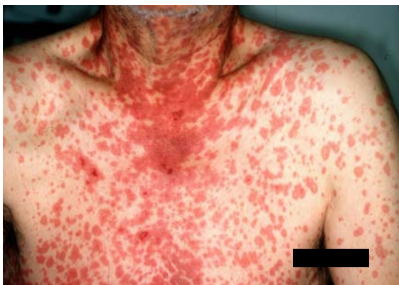
図1 体幹の浮腫性紅斑と水疱 ・びらんの例（平成20年8月追加）