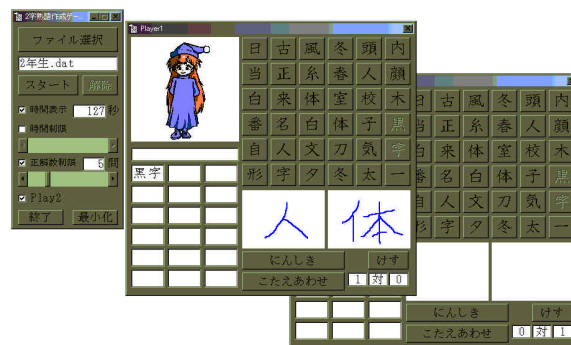
図3 教育用アプリケーションの一例

このアプリケーションを、東京農工大学科学技術展'2000 において試用した。その結果、片側のユーザの入力に対して手書き文字認識などの重い処理を行った場合に、もう片方のユーザの入力に対する処理に遅延が発生することが分かった。この問題については、アプリケーション側の処理を工夫することで対処できると考える。また、同時2入力に対応していない一般的なアプリケーションについても、問題なく動作することがわかった。