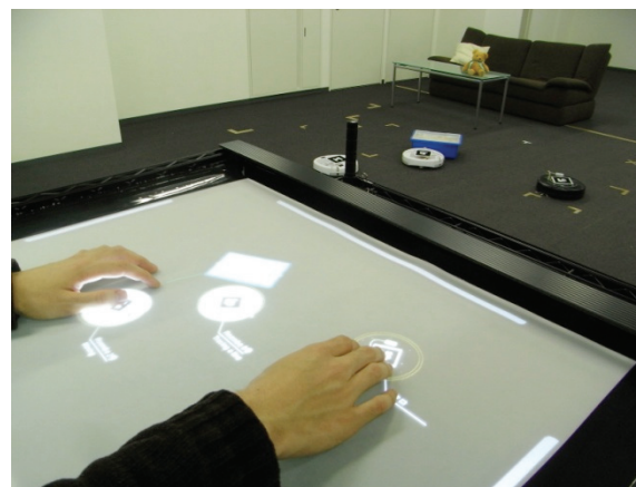
図1 マルチタッチディスプレイによるロボットの操作インタフェース

本稿ではマルチタッチディスプレイを利用して複数台のロボットを操作するシステムの提案を行う (図 1)。ディスプレイにはロボットが動作する環境の俯瞰