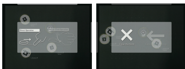
図3 モード切替時に表示される画面（左）と行動のキャンセル時などに表示される画面（右）

FTIR (Frustrated Total Internal Reflection)[3]を利用する。本方式では赤外光がアクリルパネル内で全反射し、接触した面のみ反射率が変わってディスプレイ下の赤外カメラから塊(Blob)として認識できる仕組みとなっている。