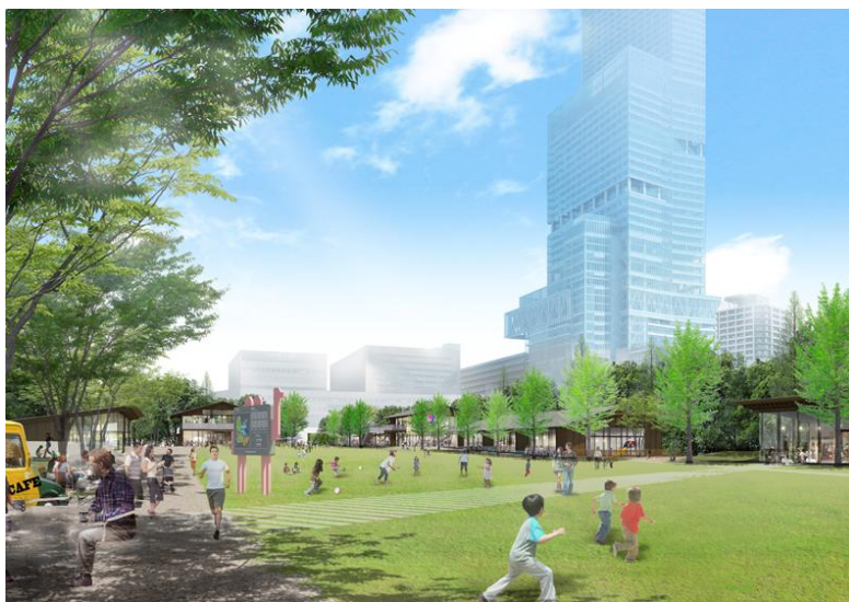
芝生広場完成予想CG(背景はあべのハルカス)

※旧近畿日本鉄道株式会社は2015年4月1日付で近鉄グループホールディングス株式会社（純粋持株会社）となりました。