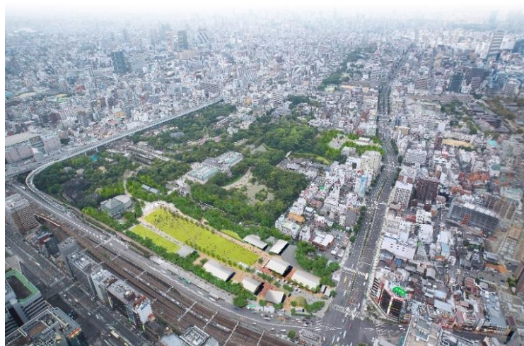
全景(あべのハルカス「ハルカス300(展望台)」から撮影)