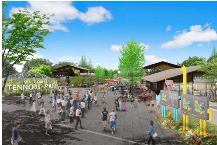
エントランスエリア完成予想CG(東側)