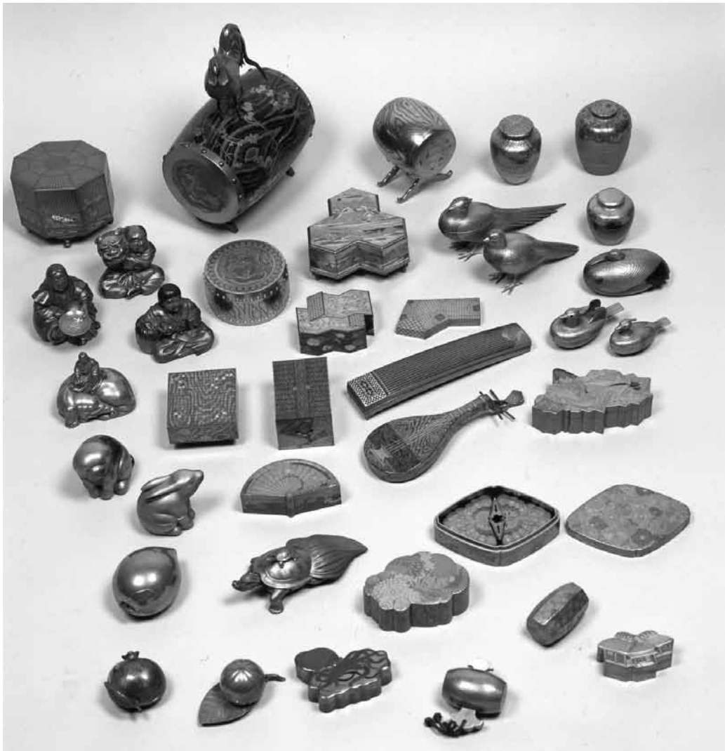
図4 カザールコレクション蒔絵香合

これらのなかには「蒔絵和泉式部形香合」「蒔絵獅子舞形香合」「蒔絵狸々形香合」など、人物・動物や道具の形を象った異形のものが多く見られる。[図4]何かの形を象ったやきものの香合は、形物香合といわれ茶湯の世界で好まれた。安政2年(1855)には主にやきものであるが、「形物香合相撲番付表」が版行されている。江戸時代の茶の湯道具として国内に伝世した蒔絵の形物香合はやきものが圧倒的に多く、蒔絵香合はあまり伝世していない。 (17) しかしカザールコレクションについてだけ見ると、蒔絵による形物の合子(箱)類が多数含まれており、それがコレクションの特色になっている。同様の蒔絵による形物香合ともいべき合子(箱)類は18世紀に日本から輸出された王侯貴族の蒐集品、それを範とした19世紀の欧米の蒐集家のコレクションに多く含まれる。