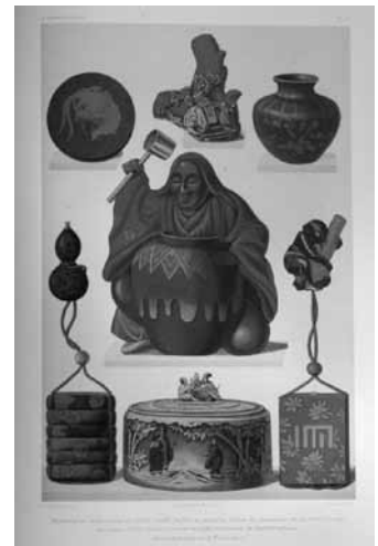
図8 “Les Collections Europeenes”に掲載された 蒔絵

エフルッシのエッセー、そしてルイ・ゴンスの“L'Art Japonais”の両誌が蔵書の中に含まれていることから、カザールは日本からの輸出漆器が18世紀の仏蘭西などにおいて、王侯貴族など限られた人々に愛好されていたという事実をこれらの19世紀にパリで刊行された書籍から得ていたことがわかる。そしてこの19世紀のコレクションがカザールの漆器蒐集に少なからず影響を与えた。