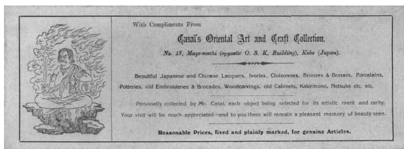
図3 カザールオリエンタルアーツ&クラフトコレクションの葉

この概略で興味深いのは現在コレクションの中核となっている「根付」がこの漆器の概要を表したリストの部分には