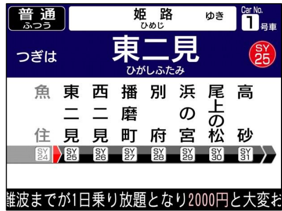
車内案内表示器 画面イメージ