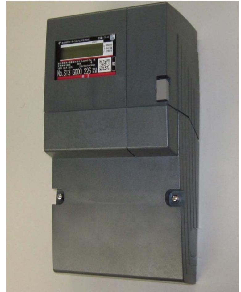
【スマートメーター】