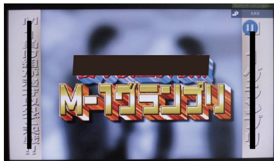
『くりいむナントカ』