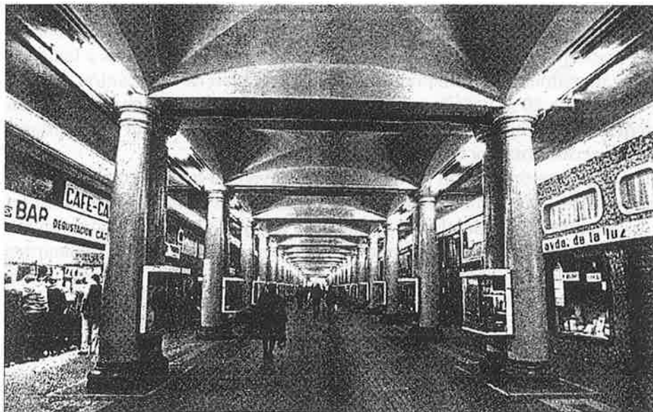
FIG. 1.—Avenida de la Luz a finales de los 70.

tigio para la ciudad, que quería ser transmitida por la Dictadura franquista y el Consistorio Municipal. Es en este escenario en el que se inaugura la Avenida de la Luz, al tiempo que se realizan obras de cierta envergadura y gran publicidad como la reforma el Paseo de Colón, o la recuperación de parte de la muralla romana.