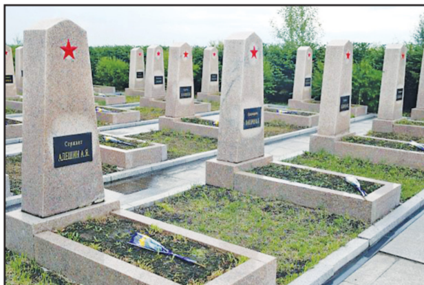
Власти Харбина выделили деньги на ремонт кладбища советским воинам

Указом Президиума Верховного Совета СССР от 30 сентября 1945 г. была учреждена медаль «За победу над Японией». Высокие награды удостоено высшее командование, в том числе Маршал Советского Союза К.А. Мерецков, награжденный орденом «Победа».