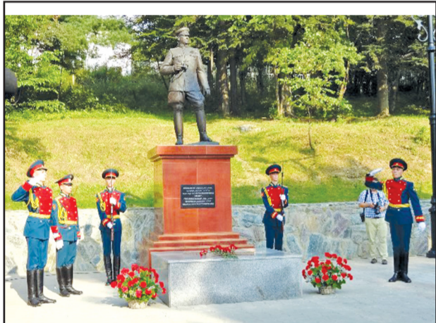
В Южно-Сахалинске открыли памятник маршалу Василевскому

Высшее советское военное командование в этот день прибыло в Харбин. Спецкор ТАСС общался: «2 сентября сюда прибыли главнокомандующий советскими вооруженными силами на Дальнем Востоке Маршал Советского Союза Василевский, командующий первым Дальневосточным фронтом Маршал Советского Союза Мерецков и главный маршал авиации Новиков. На аэродроме прибывших встретили представители советского военного командования во главе с начальником харбинского гарнизона дважды Героем Советского Союза генерал-полковником Белобородовым... Жители Харбина горячо приветствовали славных полководцев Красной армии 3 . Советские военачальники осмотрели захваченную японскую технику, которая вскоре будет выставлена на набережной Москвы-реки для всеобщего обозрения.