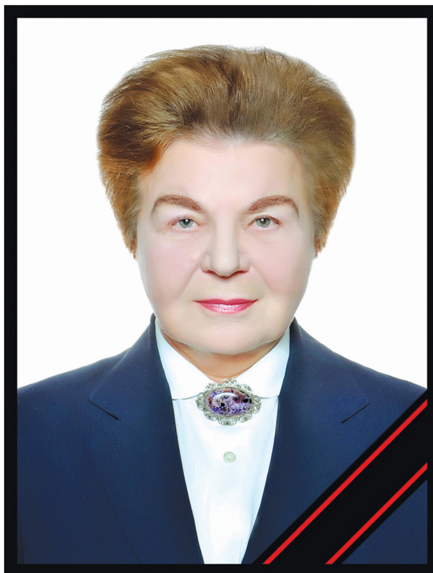
«НЕ МОГУ ПОСТУПАТЬСЯ ПРИНЦИПАМИ»

8 ноября 1991 года в Ленинграде состоялся Учредительный съезд Всесоюзной Коммунистической партии Большевиков (ВКПБ). Главная