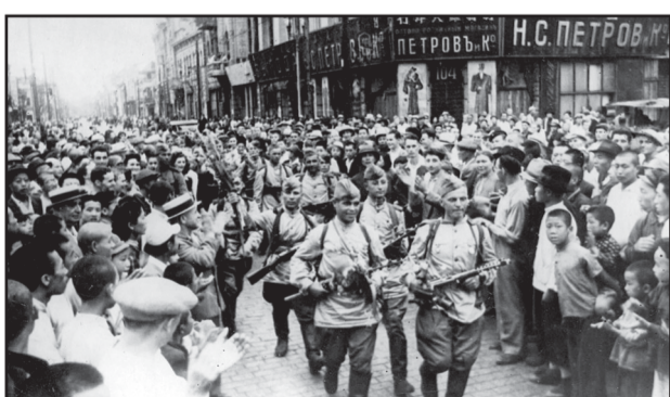
70 лет назад советские войска вошли в Харбин

Седьмого сентября в советских газетах была опубликована последняя оперативная сводка за 5 сентября от советского Информбюро. Советское руководство щедро наградило участников войны. Выше 2 100 000 человек были награждены орденами и медалями, в том числе 308 000 - боевыми. 93 солдата и офицера удостоены звания Героя Советского Союза, более 300 соединений, частей и кораблей удостоены орденов, 25 получили звание гвардейских. Почетные наименования Хинганских, Амурских, Уссурийских, Харбинских, Мукденских, Порт-Артурских, Сахалинских, Курильских и других присвоены более 220 соединениям и частям.