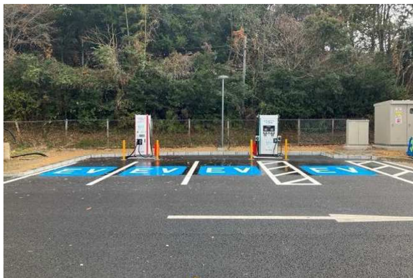
急速充電設備 (E3 九州自動車道 広川 SA 上り線)