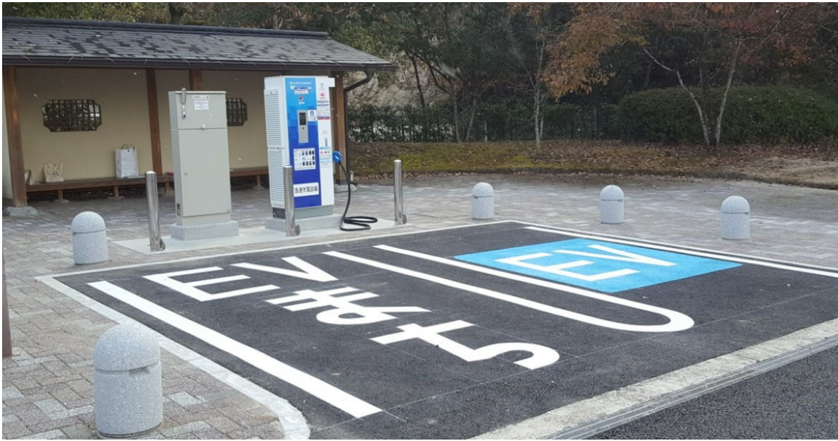
急速充電設備 整備イメージ (参考:E3 九州自動車道 玉名PA 下り線)