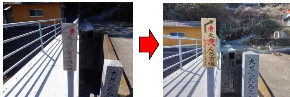
<劣化の激しい道標を改良>

昨年度33箇所同道標類を設置したが、なお迷いやすい場所に道標等を追加で設置。また、強い日射等により劣化が激しい場所については日射に強い材料を用いた改良型の道標に交換。