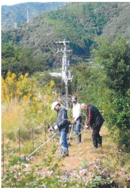
牟岐町観光ボランティアガイドの会 (牟岐町)