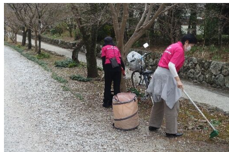
高知商工会議所女性会 (高知市)