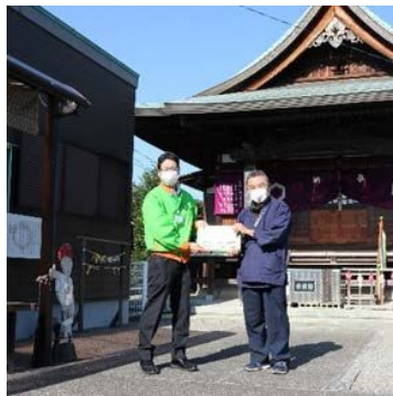
＜宝寿寺様へマップ贈呈＞