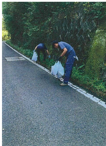
小海活性化協議会 (東かがわ市)