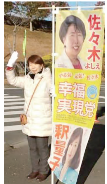
朝のご挨拶活動 実施中!

努力した人が幸福になれる世の中にしたい、人の心が明るくなれば、町全体が明るくなるように、微力ではありますが皆様の幸福推進のお手伝いをして参りたいと思います。