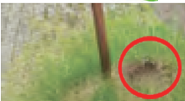
南平台 町道の歩道

子供たちも通る通学路の倒壊しそうだった木。役場につなぎ、一週間ほどで対応していただきました。