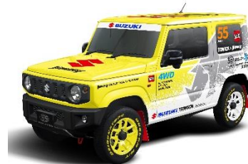
「スズキ ジムニー トミカ55周年記念仕様」