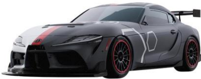
「GR スーパ GT4 EVO トミカ55周年記念仕様」

<商品ラインアップ> ※デザインイメージです。デザインは変更となる場合がございます。画像はトミカではありません。