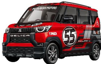
「三菱 デリカミニ トミカ55周年記念仕様」