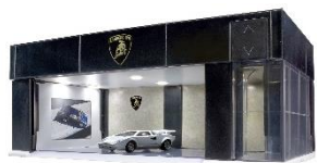
写真上) PREMIUM BLACK Edition 写真下) Lamborghini Edition