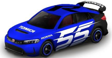
「ホンダ シビック TYPE R トミカ55周年記念仕様」