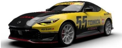
「日産 フェアレディ Z NISMO トミカ55周年記念仕様」

デザイン：株式会社テクノアートリサーチ (トヨタ自動車株式会社の国内デザイン拠点)