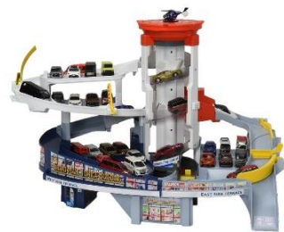
*トミカ(ミニカー)は別売りです。 *開発段階のイメージとなります。