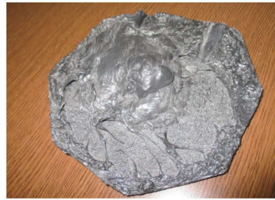
2.シールを剥がさないメッシュ 20分後