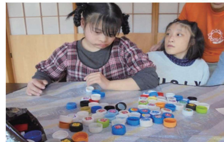
赤色シールを捜しています。見つかるかな？