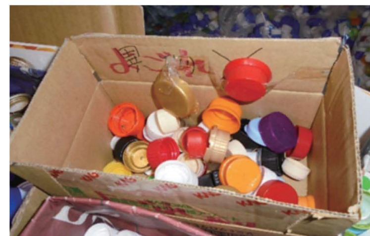
調味料のキャップは取り出します。