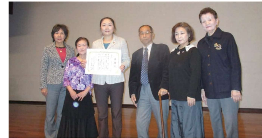
大宮ライオンズクラブのメンバーの方々

私は先にも申し上げたように、小学校2年生から近年までボイスカウト活動をしてきました。大学年代のローバースカウトの時に、1978年の国際ライオンズクラブ東京大会が東京日本武道館で開催されて、奉仕活動に行きました。世界各国のライオンズクラブの代表の方々