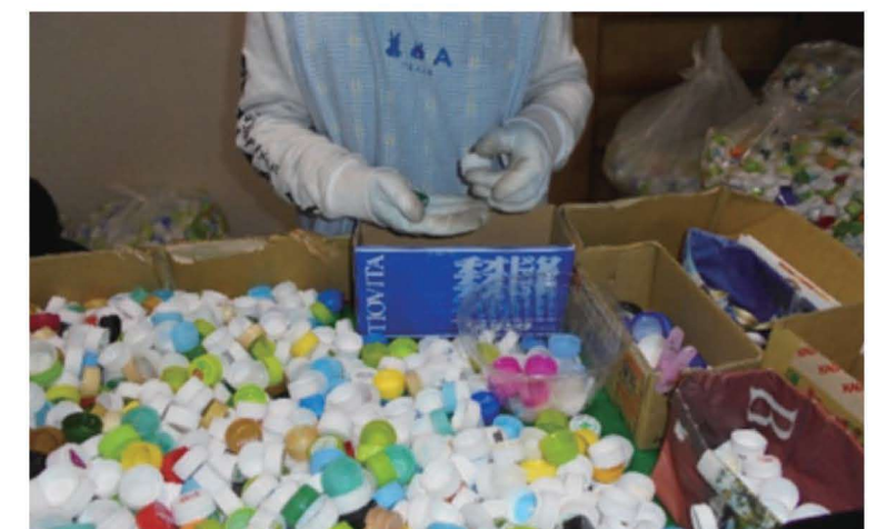
手作業で分別しています。