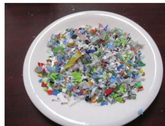
フィルム等混在価値なし

全世界で45・740クラブ、会員数は約134万人。日本国内で3・311クラブ、会員数約10万9000人（2010年3月31日現在）。単一クラブは地域の名称を冠していることが多いが、その地域に住地や事業所を有している会員の集まりというわけではない。単一クラブの会員数は、平均的には約30人、60人だが、30人より少ないクラブもあれば、60人より多いクラブも存在します。