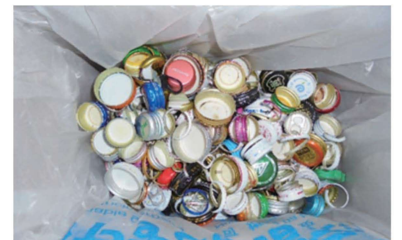
金属のキャップも入っているよ。 しっかり分別します。