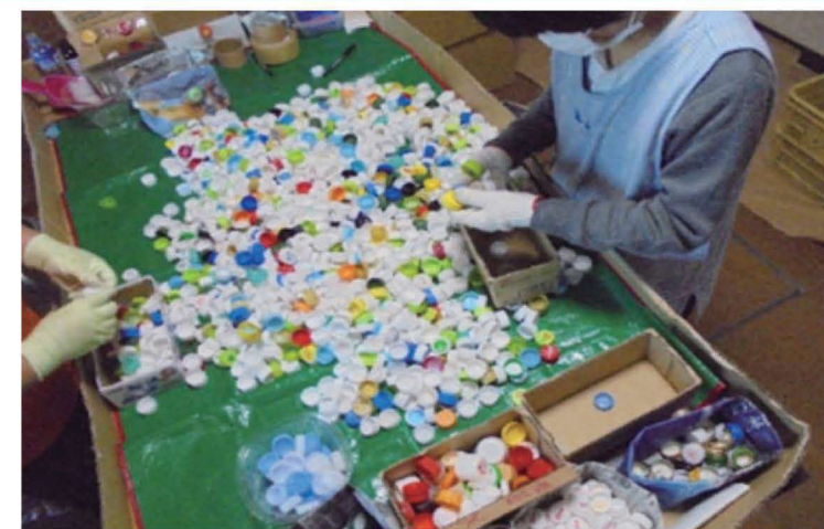
一つ一つ確認しながら分別 こたわりがあり確実に作業を行います。