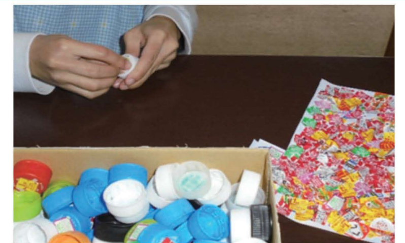
シール剥がしに集中します。 剥がしたシールアートを考案中。