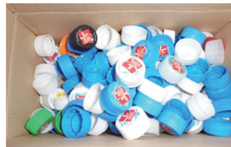
キャンペーン付のキャップ。見逃しません。