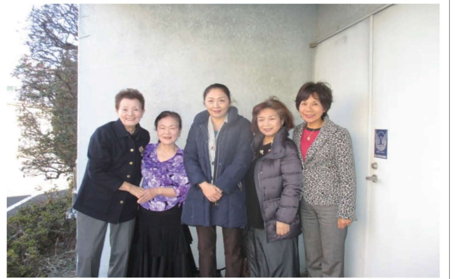
今にも雪が降りそうな天候の中、ありがとうございます。

全世界で45・740クラブ、会員数は約134万人。日本国内で3・311クラブ、会員数約10万9000人（2010年3月31日現在）。単一クラブは地域の名称を冠していることが多いが、その地域に住地や事業所を有している会員の集まりというわけではない。単一クラブの会員数は、平均的には約30人、60人だが、30人より少ないクラブもあれば、60人より多いクラブも存在します。