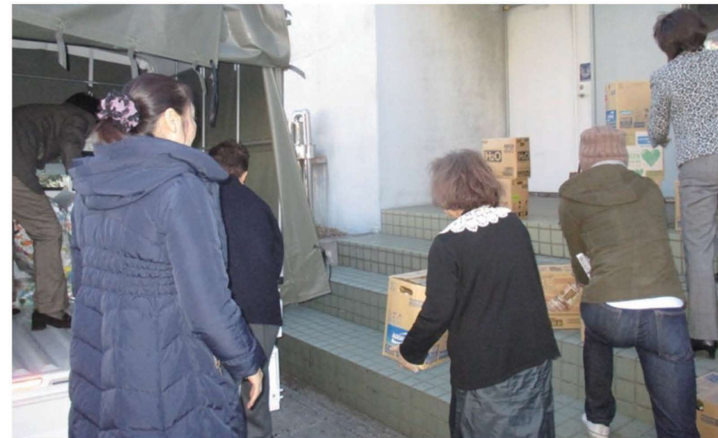
1. キャップを積み込むライオンズクラブの会員

全国の慈善団体には、エコキャップ運動のご協力をいただき感謝申し上げます。 今回は中でもライオンズクラブのご協力は特に多くあり、ライオンズクラブの中で女性会員だけ