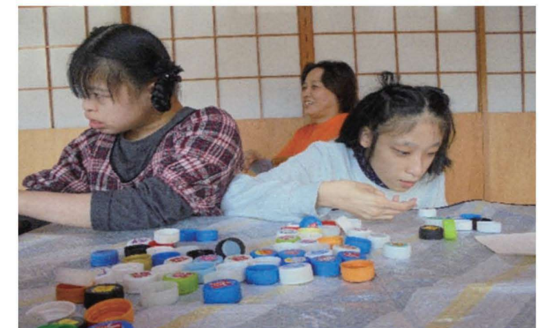
私は白のキャップ。上手に剥がすわよ。