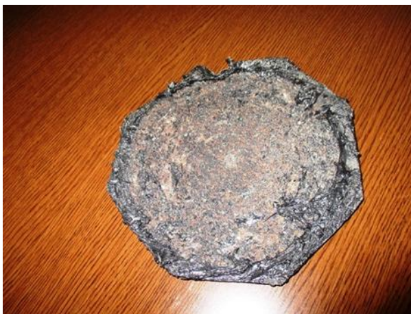
右写真 シールを剥がしたメッシュ 8時間後