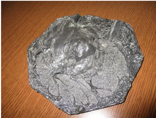
中写真 シールを剥がさないメッシュ 20分後