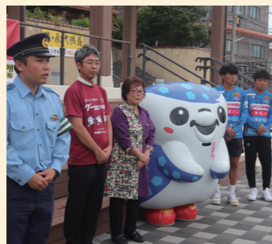
県交通安全協会様と連携し、地域の交通安全イベントを協業で開催しました。クラブマスコットのジンベーニョに子供たちも大喜び。