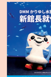
1 DMM水族館館長に就任