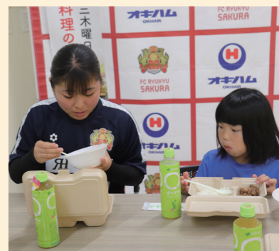
沖縄の未来をつくる女子チーム「FC琉球さくら」は孤食の課題解消へ子ども食堂×サッカー教室のイベントを開催。