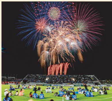
8/31に全島サッカー祭りの日に、「日本一のスタジアム花火」を開催。離島の子供たち160名を招待し合計8,755人の来場者とサッカー観戦と花火を楽しみました。