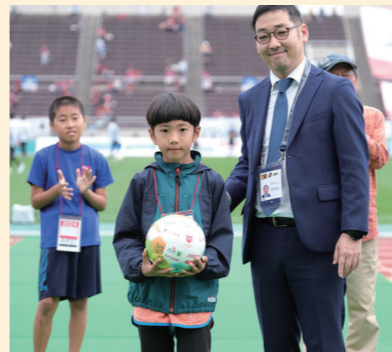
今年で5年目になる「夢ボール」企画では沖縄県全ての小学校(263校)に小学生がデザインしたサッカーボールをプレゼントしました。