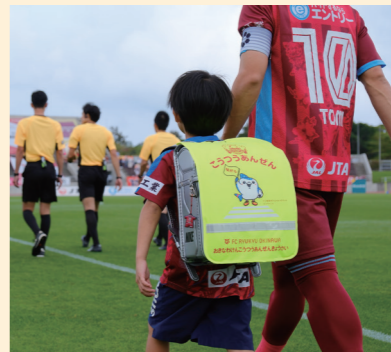
ジンベーニョデザインのランドセルカバーを作成し、合計約5,500枚分沖縄県内の新小学一年生に配布。