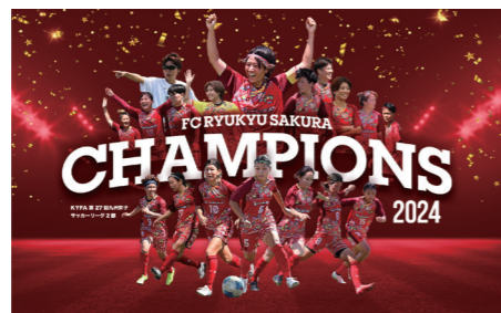
発足一年目で九州2部リーグ優勝！応援ありがとうございます！