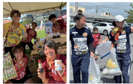
フードドライブ活動以外にも様々な活動に参加しました。