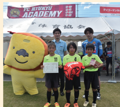
久米島や石垣島など離島も含めた各地域でサッカー教室や大会などを開催し、サッカーの普及と子どもたちの成長の場を提供しています。