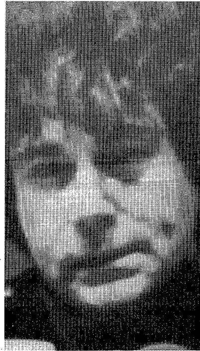
Gabilondo mantiene un diálogo diario con Casamajor / Sardà, y Quintero tendrá programa en octubre

Jesús Quintero, más conocido como "el Loco de la Colina", título del espacio que lo lanzó a la popularidad, es uno de los fichajes de la Ser, a través de "Contigo he vivido", tras una ausencia del medio radiofónico de más de seis años. El programa, de una hora de duración, se emitirá diariamente a partir de oc-