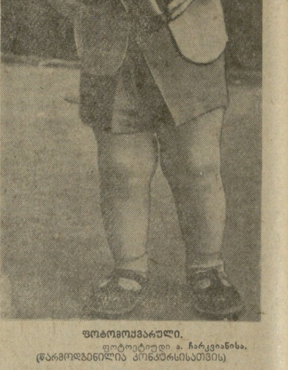
კეთილშობილური საქციელი. კეთილშობილური საქციელი.

კოლმეურნე ქალაქი დათვი მოკლა. კოლმეურნე ქალაქი დათვი მოკლა. კოლმეურნე ქალაქი დათვი მოკლა.