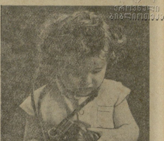
კეთილშობილური საქციელი. კეთილშობილური საქციელი.

კეთილშობილური საქციელი. კეთილშობილური საქციელი. კეთილშობილური საქციელი. კეთილშობილური საქციელი. კეთილშობილური საქციელი.