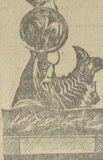
ქართული და მისი მსგავსების ერთადერთი საერთაშორისო კონკურსი.

ქართული და მისი მსგავსების ერთადერთი საერთაშორისო კონკურსი. დიდი გულიანობით და სტრუქტურულად განსხვავებულია და სხვა.