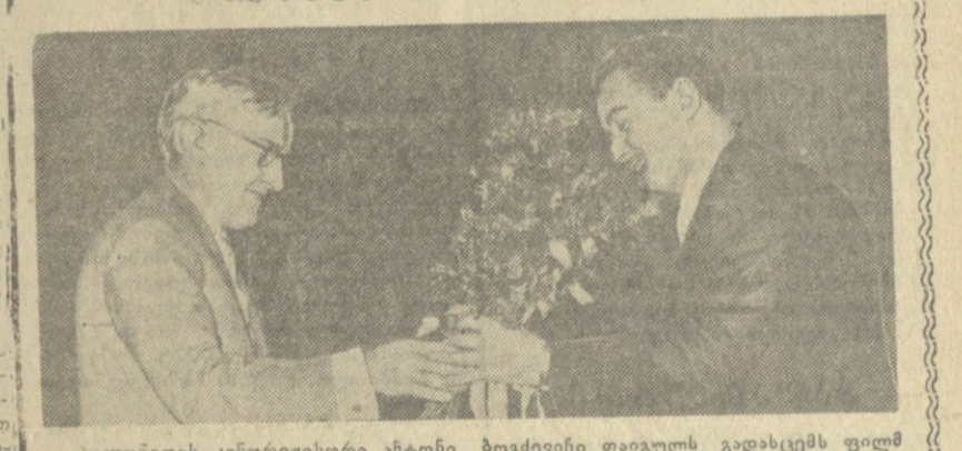
პოლონეთის კომუნისტური პარტიის მდივანი...