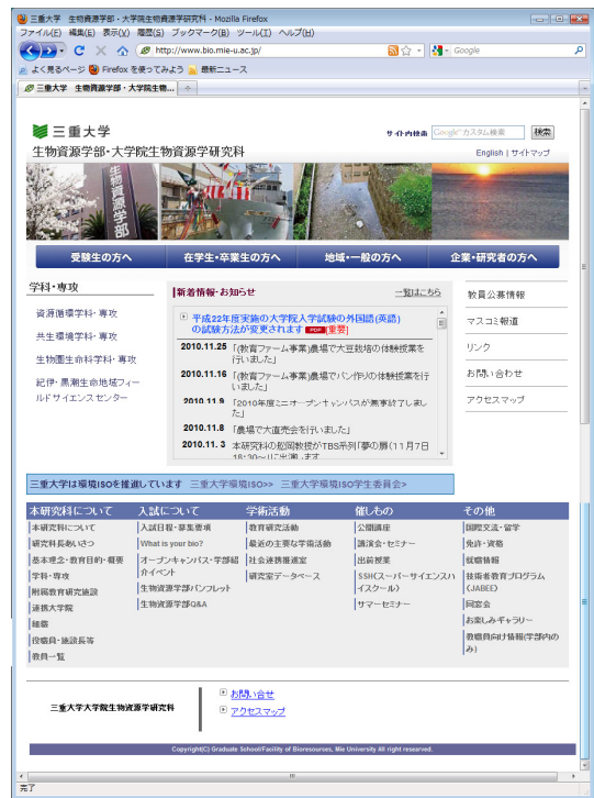
図2 現在の生物資源学部ホームページ

現在作成中のホームページのコンセプトとして、生物資源学部ホームページのデザインを踏襲し、トップページが画面解像度1024×768で一覧表示でき(実際のホームページでは800×600を基本として考えている)、文字を出来るだけ大きくすることとする。また直感的にわかりやすく見やすいホームページ作りを目指している。