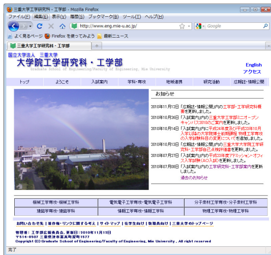
図3 現在の工学部ホームページ

工学部ホームページのリニューアルは平成23年の7月頃完成を目指し、現在デザインやコンテンツ等を検討中である。またCMSの導入におけるメリットや構築までの時間も含め現在検討中である。