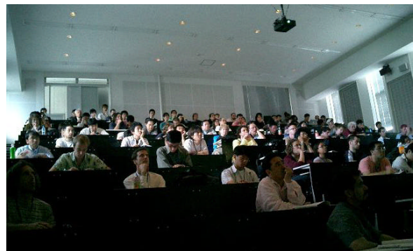
Fig.4 ペーパーセッションの風景

NIME04では会議そのものにテーマの共通性があり、ICMCほどの規模に至らないために、ペーパーセッションに個々のタイトルを付けて分類せずにシングルトラックの研究発表セッションはオムニバスとした。唯一のテーマセッションはRENCONであり、この成果報告はWebで公開されている[5]。