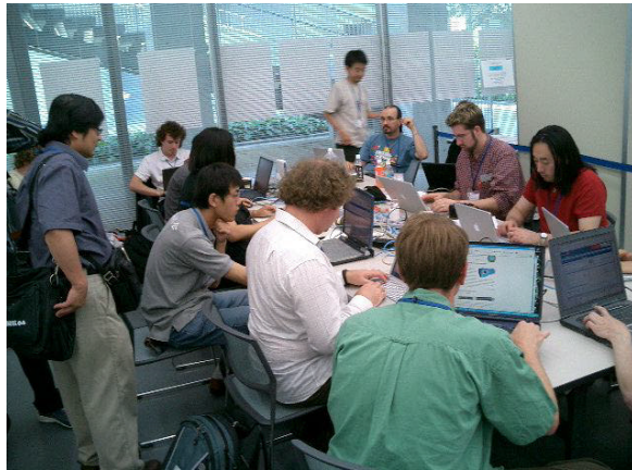
Fig.1 受付のネットコーナーに群がる参加者

となった。海外から参加した日本人、国内から参加した外国人も多数いたので概略であるが、外国人と日本人の比率はおよそ半々であった。以下はその一部の風景である。