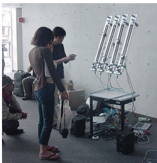
Fig.9 LEMURのギターボット展示風景