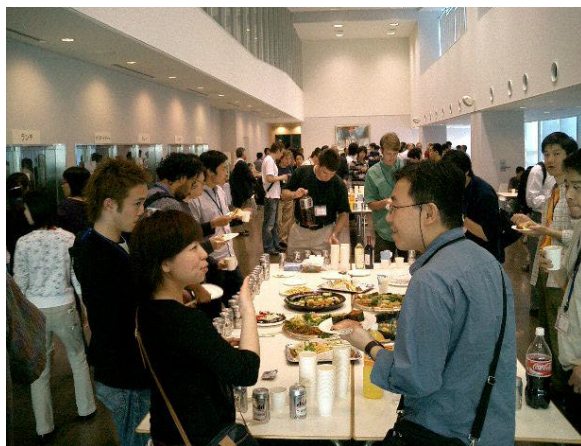
Fig.2 レセプションの風景

NIMEでは発表論文をPDFとして全てWebで公開している[2]が、ISBN4-9902099-0-7として論文集Proceedingsも刊行した。Proceedingsの注文/入手方法へのリンクはNIME04のフォトレポートWebページ[3]にある。