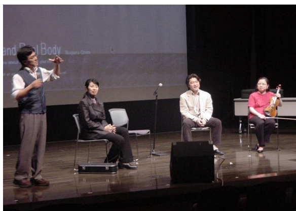
Fig.10 公開レクチャーコンサートのトーク風景