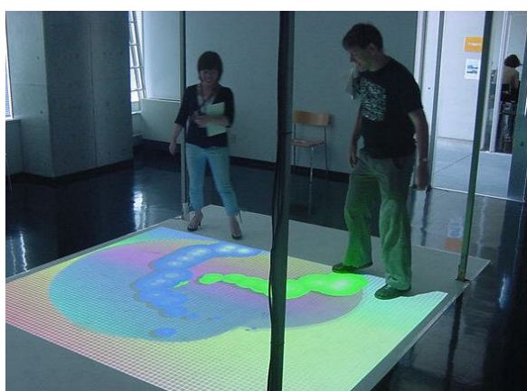
Fig.6 デモセッションの一風景