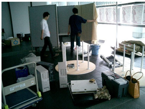
Fig.8 インスタレーションギャラリー設置風景