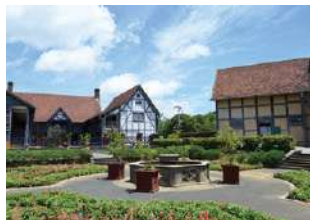
フォーマルガーデン

16世紀の古い建物や町並みが残るストラットフォードにあるシェイクスピアの生家を忠実に再現した建物です。テナントショップ及び貸しギャラリーが入っています。料金、ご予約はインフォメーションにて承ります。