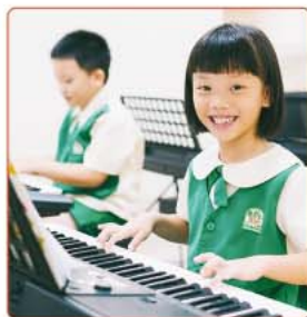
脳の発達を効果的に促す人気の「音楽プログラム」

当園のカリキュラムは「K.I.N.D.E.R」に基づき、さまざまな分野を垣根なく学べるよう構成されています。子どもたちは五感をフルに使いながら、学びを深めていきます。さらに遠足や多彩なエンリッチメント・プログラムで視野を広げていきます。