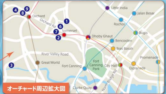
オーチャード周辺拡大図