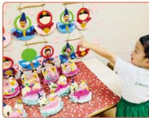
日本語を学ぶだけでなく日本文化に親しむプログラム

A マリンパレード校では、日英の「バイリンガル・プログラム」があり、日本語は日本語を母語とする教員、英語は専任の教員が毎日指導します。「日本語クラス」は、日本語を学ぶだけでなく、日本の伝統文化や季節の行事に親しむことで日本人としてのアイデンティティがしっかりと確立するよう導いています。例えば2月には「節分」、3月には「ひなまつり」のお祝いをするなど、年間を通じて日本の年中行事に触れることができます。また、「旧正月」や「ハリラヤ」、「ディパバリ」などシンガポールの代表的な伝統行事もお祝します。