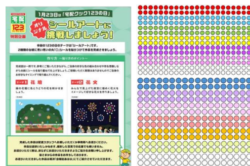
オリジナルシールアート

『宅配クック ワン・ツウ・スリー』では、利用者に日頃の感謝の気持ちを表す特別な日として1月23日を“123の日”と設定し、“ご馳走の日” *1 と併せてスペシャルメニューのお弁当と、ちぎり絵や塗り絵パズルなどご自宅でも手軽に楽しんでいただける記念品をお届けしてきました。今回は、令和6年能登半島地震から1年となる2025年1月に、『宅配クック ワン・ツウ・スリー』を通じて被災地を応援したいという想いで「越国弁当」をご用意いたしました。北陸4県である新潟、富山、石川、福井の郷土料理をお楽しみいただけるお弁当です。石川県輪島市では2024年1月に震災、9月に豪雨災害があり、未だ復旧までの道のりが困難な状況下にあります。海と山に囲まれたこの地域は、漁業も盛んで、自然環境にも恵まれていることから、今回は海の幸・山の幸を活かした郷土料理を集めました。石川県・富山県の郷土料理「ぶり大根」をメイン惣菜に、「ぜんまいの煮物」「ととぼち揚げ」「彩り高野巻き」「加賀れんこんの煮物」「赤ずいきの酢の物(すこ)」を副菜に添えました。ご当地の食材を『宅配クック ワン・ツウ・スリー』のお弁当に使用することで、少しでも被災地の力になれればと考えております。これに加え、記念品として「オリジナルシールアート」をご用意。2種類用意された背景