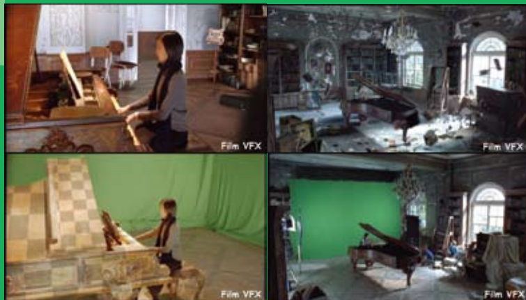
《不能說的·秘密》中的「時光逆轉旅程」，舊琴室桌椅、壁畫和天花旋轉飛舞，使整個琴室的佈置完全改變，看來複雜，實際拍攝時只用一幅綠幕就可以了。