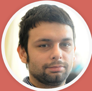
аутор: Nicolò Caranti лиценца: cc-by-sa-3.0

Поново бих имао неке грандиозне идеје и планове које вероватно није баш могуће испунити, али надам се да ћемо и за 10 година кад се осврнемо уназад бити бар подједнако задовољни постигнућим као што смо сад.