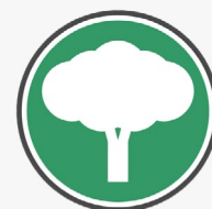
Фото садржај Вики воли Земљу је познато светско фото такмичење у сакупљању слободних фотографија заштићених природних добара, које сваке године привлачи све већи број учесника и пажњу медија. Поред тога, редовно организујемо и Фото сафари , где прибављамо слободне фотографије културно-историјских и природних добара мање познатих делова Србије