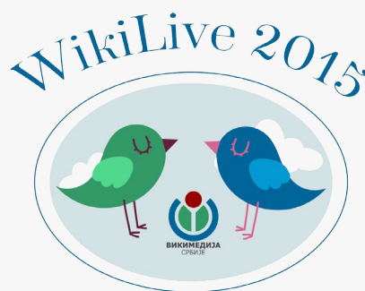
аутор: Jelena Ignjatović лиценца: cc-by-sa-4.0

* ЕДУ Вики конференција имала је за циљ да, кроз двосмерно комуницирање, представи и упозна образовне и научне институције са пројектима Викимедије, посебно са Образовним програмом, као и информисање државних институција о позитивним аспектима слободног знања, али и потенцијалу увођења Викимедијиних пројеката у наставни програм образовних институција у Србији.