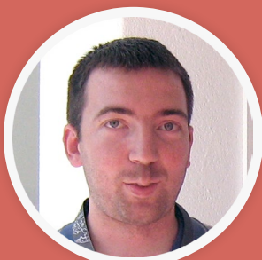
аутор: Djordje Stakić лиценца: cc-by-sa-3.0

Будућност се не може сасвим предвидети, никада се не зна шта околности могу ново да донесу. Вероватно има више могућих сценарија који нису потпуно под нашим контролом него се личу правца којим наша земља и друштво у целини иде. ВМРС би могла да буде спожер многих активности које се личу слободни знања, образовања, што је негде њена природна улога. Искрено бих волео да наше друштво крене тим путем, да постигне друштво знања, да такве ствари добију већи замах у наредном периоду и да Викимедија Србије нађе у њима своје место. Има добрих назнака да би се могло ићи у том смеру и кроз сарадње са факултетима, библиотекама, архивима, музејима, да се заједничким трудом знање које имамо представимо и учинимо доступним свима на Вебу.