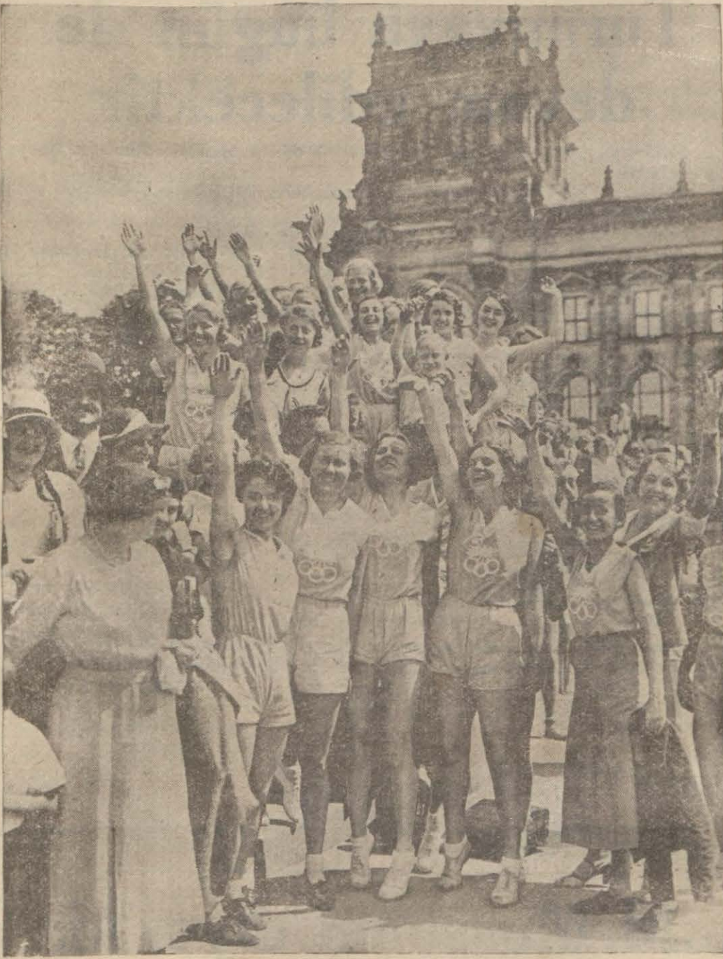
Genç Alman kızları jünnastik bayramında Rayıştağ önünde...

Gençler zamanınızın, günlerinizi, dakikalarınızın kıymetini bilin.