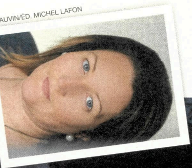
M. THALVIN/ÉD. MICHEL LAFON