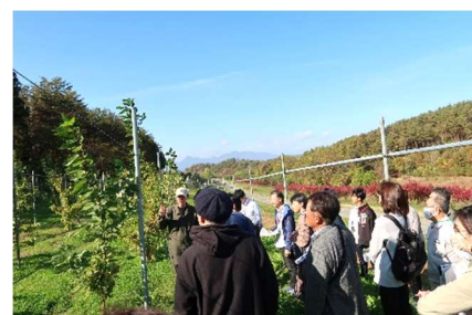
現地研修 (現場スタディ2)