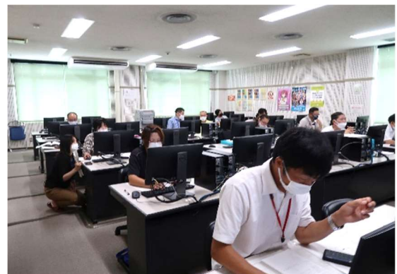
戦略計画策定の個別指導（農業経営）