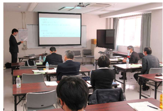
戦略計画のプレゼンテーション