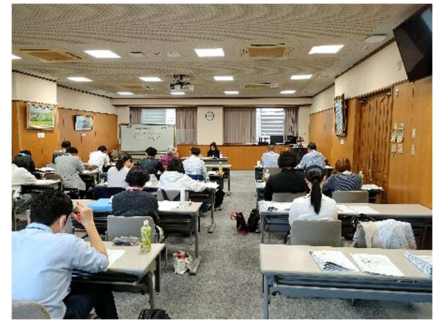
講義風景 (会計・財務管理と経営診断)