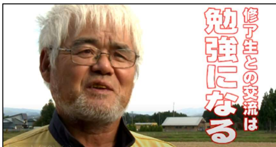
【平成 20 年度アグリ管理士】