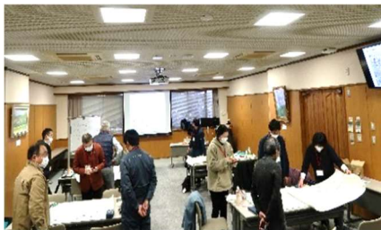
演習風景 (デザインとブランド)