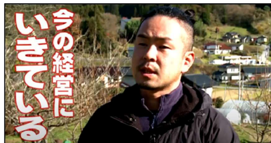
【平成 30 年度アグリ管理士】