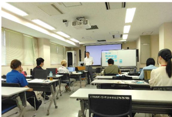
戦略計画策定の個別指導（農村地域）