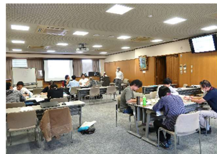
講義風景 (地域マネジメント論)