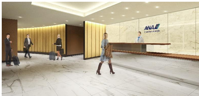
ANA LOUNGE 受付