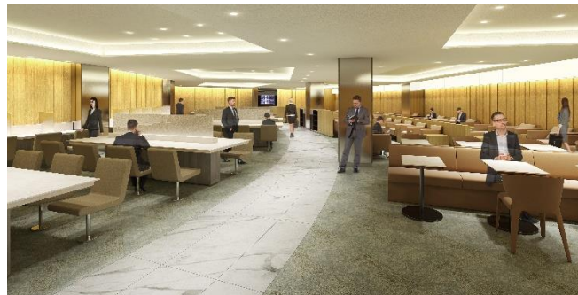
ANA LOUNGE 内観

ANA は 2020 年 3 月 29 日、成田空港第 1 旅客ターミナル第 2 サテライトに ANA LOUNGE を新設します。現在の第 4、第 5 サテライトのラウンジに続き、成田空港では 3 つ目の ANA LOUNGE となり、第 2 サテライトやバスゲートからご出発のお客様の搭乗口までのアクセス利便性が大幅に向上いたします。