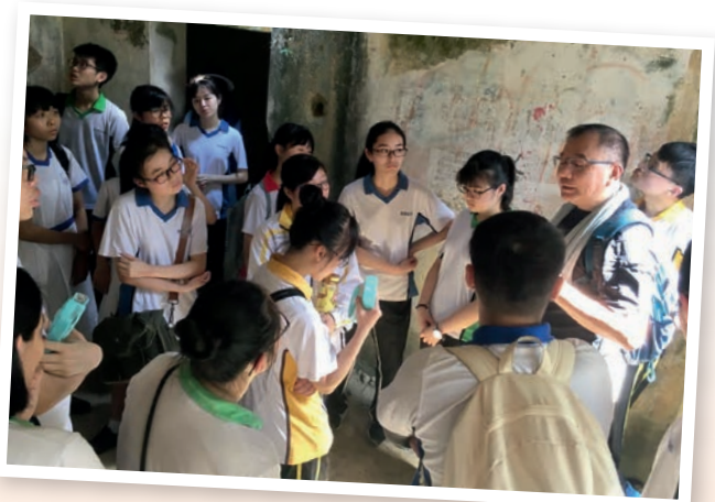
▲學生於戰場遺址細心聆聽導賞員的講解

歷史是一門研究人類過去的學科，同時也是一門探求真相的學問。我很重視探究式學習，使學生根據歷史資料及現有知識，評價歷史事件及人物，探究各種歷史議題。我常以情境教學法讓學生觸摸歷史，如讓學生透過「新紐倫堡審判」的角色扮演，理解有關納粹德國二次大戰的戰爭責任問題，提高學生的明辨性思考等高階思維能力。我認為這類以疑難為本的課堂模式更能讓學生投入歷史情境，更能刺激他們思考，達至分析歷史事件的教學目的。