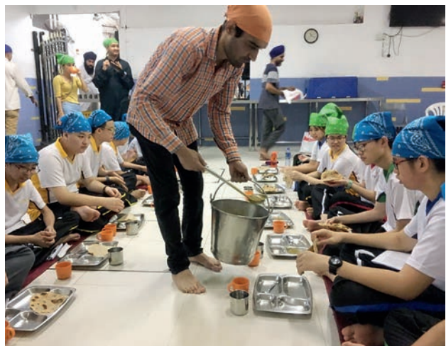
▲學生在居港少數族群歷史考察活動中體驗錫克教徒的生活

現已完成開發高中歷史科的電子問題庫，讓老師於歷史科課堂中使用，以提高學生的學習動機。