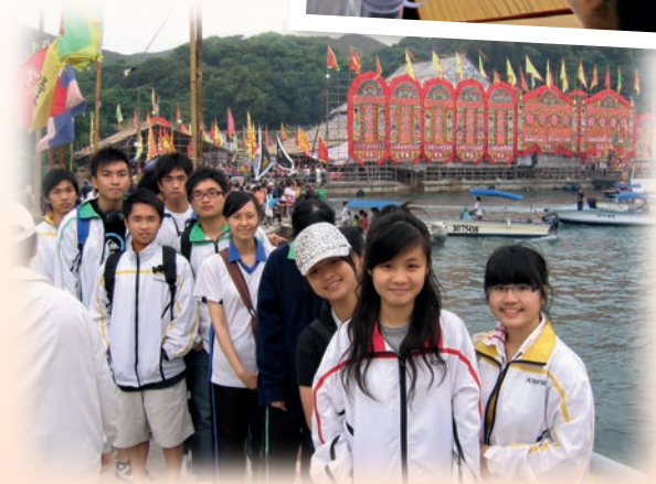
▲ 學生考察糧船灣天后誕活動