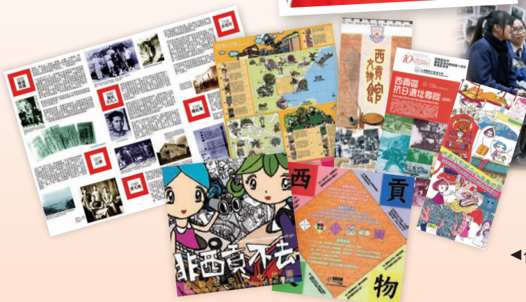
◀ 傅老師與學生一起製作各種西貢區歷史文化單張