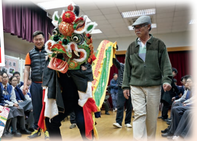
▲ 傅老師為學生舉辦活動，介紹聯合國非物質文化遺產「舞麒麟」。