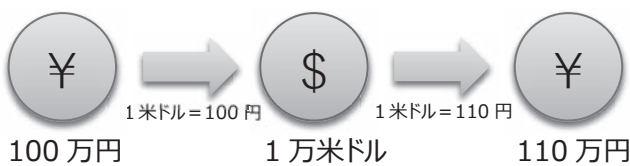
（例1）利益が発生するケース