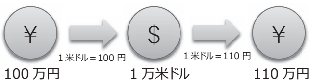
（例1）利益が発生するケース