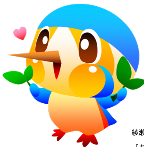
綾瀬市マスコットキャラクター 「あやびい」