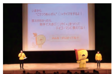
交通安全に関する〇×クイズを実施しました。