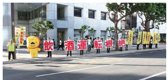
宮古・八重山を含む県内11か所で実施しました。