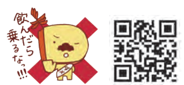
スマートフォンなどでQRコードを読み取ると、LINEスタンプショップにリンクします。