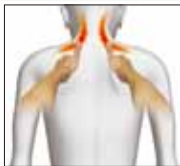
・ループもみ上げ

もみ/たたき動作時に昇降動作を組み合わせることで、より手技に近い、広範囲に引き上げる感覚のマッサージ感を生み出します。