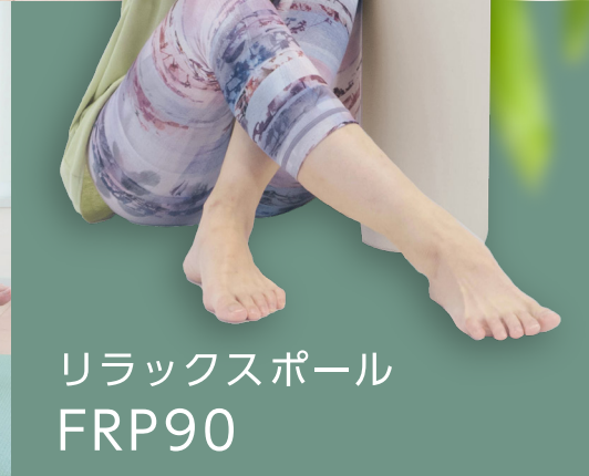
リラックスポール FRP90