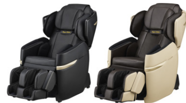
ブラック(BK) ページュxブラウン(CB) JANコード: 4951704171472 JANコード: 4951704171489