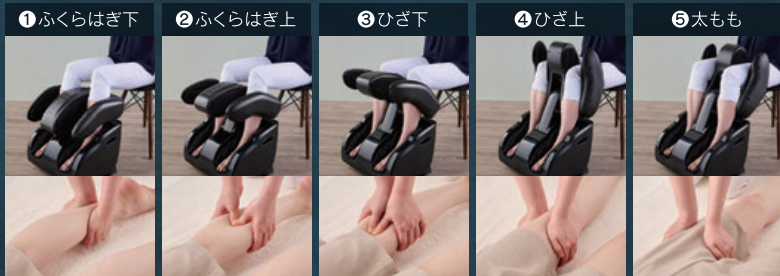
①ふくらはぎ下 ②ふくらはぎ上 ③ひざ下 ④ひざ上 ⑤太もも もみ板でギュッと絞り、ふくらはぎ裏を突起付きローラーでしっかりマッサージ もみ板と先端の指圧突起でグイッとほぐすようにマッサージ