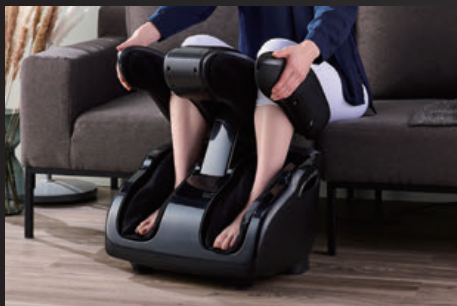
ラチェットウィング

気になるふくらはぎから太ももまでのマッサージ位置を手動で5段階の角度調節ができます。