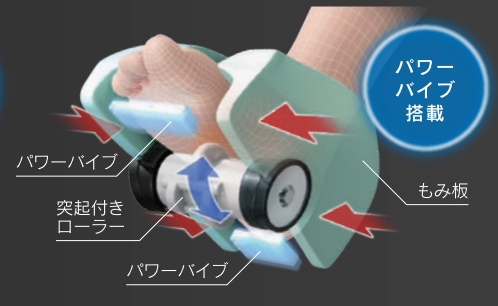
足裏つかみ指圧 ※2 & パワーパイプ

もみ板でつかみながら、足裏を突起付きローラーがもみほぐし、同時に強力な振動で心地よく刺激します。