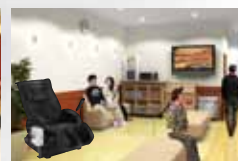
アミューズメント施設