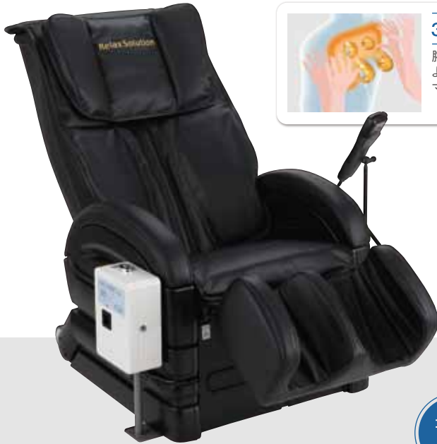
リラックスソリューション

もみ玉による背骨両側の筋肉 への刺激により、腰部の疲労や 神経痛・筋肉痛の痛みを緩和。