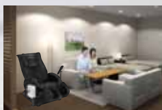
ホテル客室・ リラクスペース