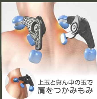
上玉と真ん中の玉で 肩をつかみもみ

肩はつかんでほぐし、背中では広範囲に、腰は深く、お尻は下部まできめ細かくマッサージする「GRIP式メカ3.0 SMART」を搭載。こだわりのもみ心地を継承しながらコンパクト化を実現。さらに「360度回転もみ玉」と「S字フィットフレーム」がなめらかなで心地よいマッサージを行います。