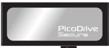
スライドスイッチ